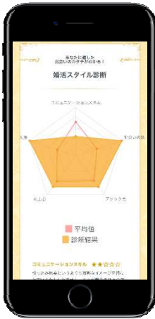
※診断結果イメージ

現在取り組んでいる婚活手法や、日頃の行動、価値観をもとに恋愛力を診断するツールです。診断だけで終わるのではなく、結果をもとにしたオススメの婚活手法を提示。結婚相談所・恋活アプリ・婚活イベントといった支援サービスとともに、友人の紹介や食事会も含めてフラットにご紹介します。結婚に向けた相手探しを希望している方が、自分に合った方法を選択する手助けをいたします。